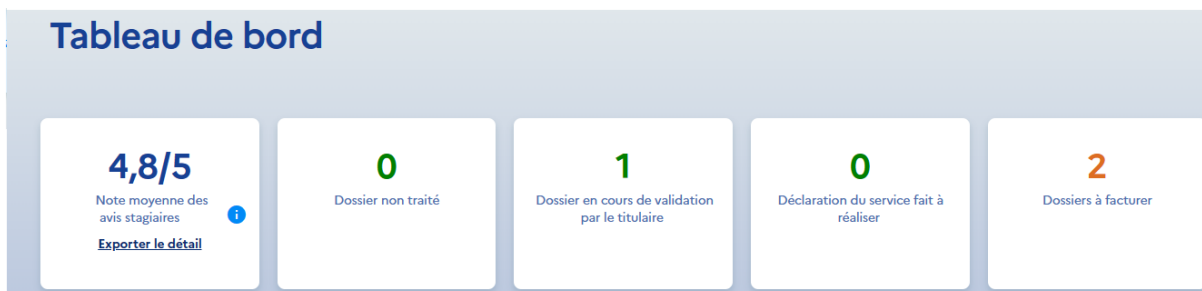
Tableau de bord